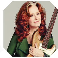
- ಬೋನಿ ರಾಯಟ್ ಅಮೆರಿಕದ ಹಾಡುಗಾರ್ತಿ

ಸೂರ್ಯನ ಬೆಳಕಿನಷ್ಟು ದೊಡ್ಡ ಶಕ್ತಿಮೂಲ ಯಾವುದಿದೆ! ಅದನ್ನು ಯಾರೂ ಸ್ವಾಧೀನ ಪಡಿಸಲಾರರು ಮತ್ತು ಯಾರೂ ಅದಕ್ಕೆ ತೆರಿಗೆ ವಿಧಿಸಲಾರರು !